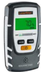
MoistureFinder Compact + סוללה