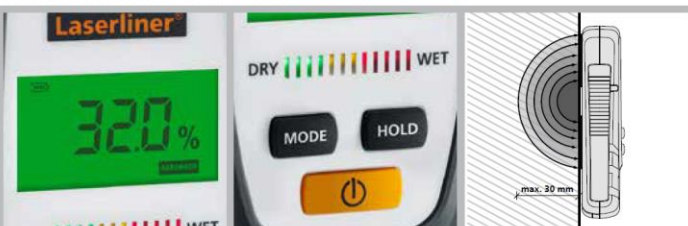
תצוגת LCD גדולה וברורה